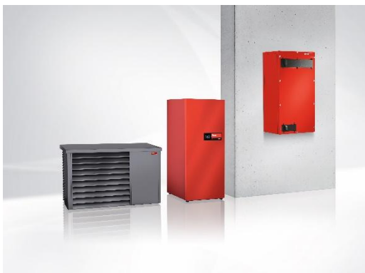
Wärmepumpe Hoval Belaria® pro mit Komfortlüftungsgerät HomeVent® ER