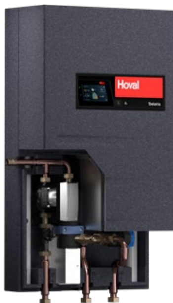
Belaria® pro comfort (8, 13, 15)